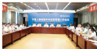
▲ 7月22日,集团2017年上半年运营管理工作会议在总部大楼六楼会议室召开。