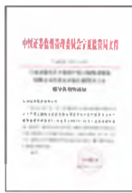
▲ 3月7日,中国证券监督管理委员会宁夏监管局下发了《关于接受宁夏上陵牧业股份有限公司首次公开发行股票并上市辅导并备案的通知》,此举标志着上陵牧业已进入首次公开发行股票并上市的辅导阶段。