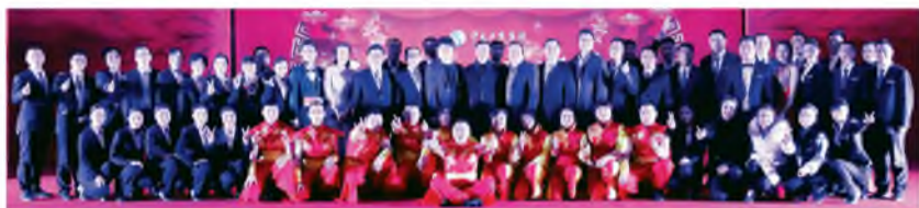
▲ 1月19日晚,固原新时代购物中心2017年“不忘初心 砥砺前行”新春联谊晚会精彩上演。