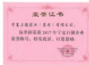
▲ 11月30日,2017年宁夏百强企业评审发布活动在宁夏悦海宾馆会议中心举行。上陵集团从数百名企业中脱颖而出,再度入围2017年度宁夏百强企业,至此,集团已连续5届荣获宁夏百强企业荣誉称号。