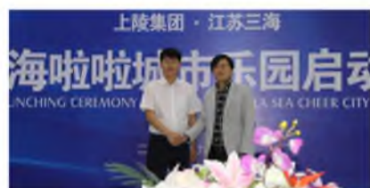
▲ 9月16日,宁夏上陵集团与江苏三海旅游文化发展有限公司共同签署固原“海啦啦城市乐园”项目合作协议,标示着固原海啦啦城市乐园项目正式启动。