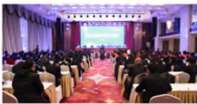
▲ 1月22日,宁夏上陵集团召开了2017年度运营管理工作会议,当晚举办了2017年迎新春文艺晚会。