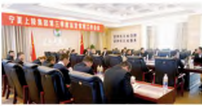
▲ 10月26日至28日期间,集团分板块召开三季度运营管理工作会议。