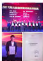
▲ 4月27日,宁夏上陵集团新华街星华汇项目荣膺“2017西北最值得期待商业项目”奖项。