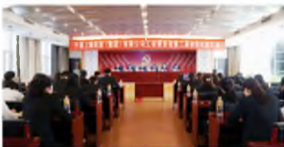
▲ 4月24日,宁夏上陵集团召开工会职工代表大会,选举产生了集团第二届工会委员会委员。