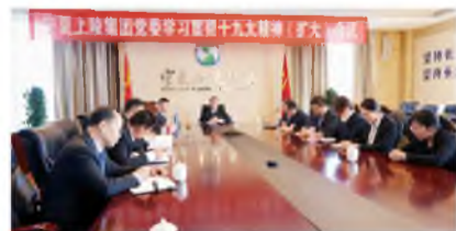
▲ 11月3日,集团党委召开扩大会议传达学习党的十九大及自治区党委十二届二次全会精神,安排部署集团各部门、各支部深入开展会议精神学习贯彻工作。