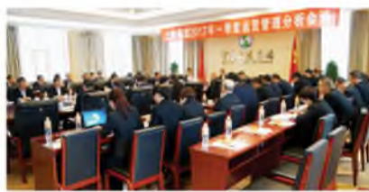
▲ 4月16日,宁夏上陵集团召开一季度运营管理分析会。