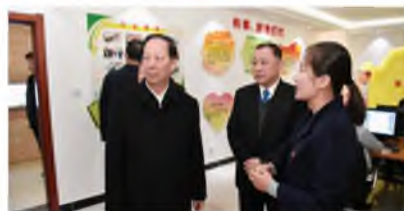
▲ 11月15日,自治区党委书记、人大常委会主任石泰峰,自治区党委副书记、银川市委书记姜志刚,自治区党委常委、秘书长纪峥等区市在集团董事长的陪同下,莅临集团汽车广场,调研视察贺兰县汽车销售行业党群活动服务中心。