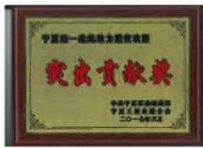
▲ 3月23日,自治区党委统战部召开统一战线“助力脱贫攻坚”行动推进会。宁夏上陵集团被自治区统战部授予“助力脱贫攻坚”行动突出贡献企业荣誉称号。