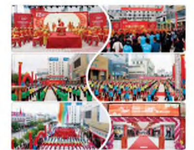
▲ 9月8日,固原新时代购物中心开业12周年盛典活动隆重开启。