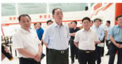
▲ 7月6日,自治区党委副书记、银川市委书记姜志刚、银川市、贺兰县相关领导一行莅临上陵集团汽车广场参观贺兰县汽车销售行业党群活动服务中心,上陵集团党委书记、董事长史信,党委副书记李建国陪同调研。